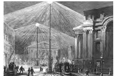
Luci elettriche che illuminano le strade di Londra (aprile 1881).

dell'esistenza e aveva un valore culturale e religioso molto importante, al di là del bisogno fisiologico.